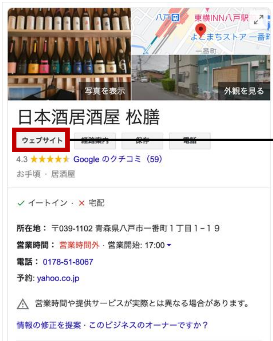
Googleマイビジネス 表示ページ (イメージ)