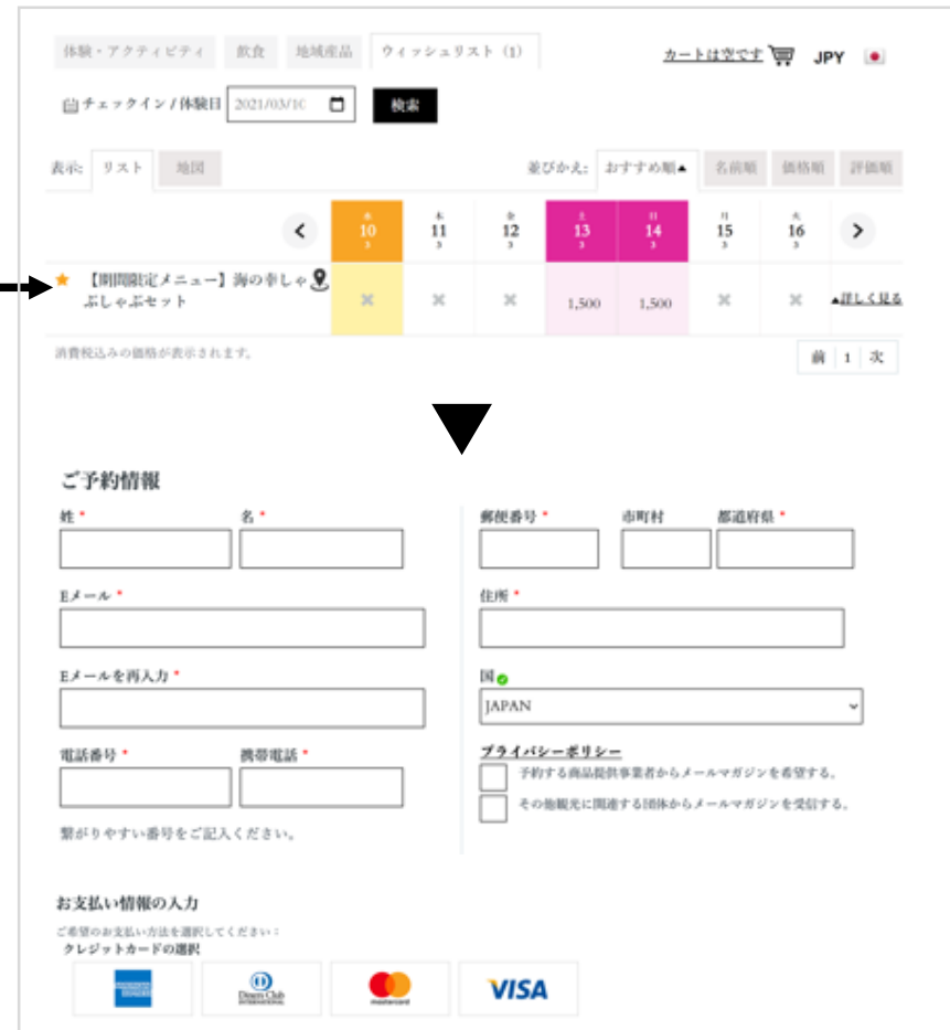
予約・購入ページ (イメージ)