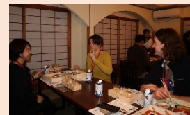
奈良の食農の歴史にちなんだお酒と料理を茶懐石として楽しんでいただいた