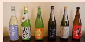
今回のお酒は「濁り酒」

本格茶会では、日本の茶の湯文化に触れて、それぞれに奥行きを深さ、先人たちが残した文化遺産におもいをはせたようです。